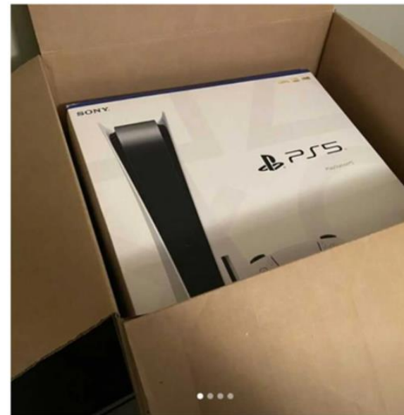
Sony Playstation 5 PS5 Disc Version ***In Hand & Ready To Ship*** 🚚 $300 $449 · In Stock

ዝኾነ ኣብ ኢድካ ዘሎ ኣቅሓ ኣይተረክብ፤ እስካዕ ምሉእ ክፍሊት ዝፍጸም።